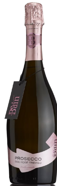
ROSÉ BRUT MILLESIMATO