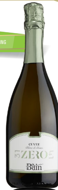
CUVÉE EXTRA DRY VINO SPUMANTE