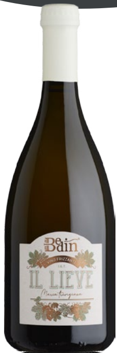
IL LIEVE MARCA TREVIGIANA IGT VINO FRIZZANTE