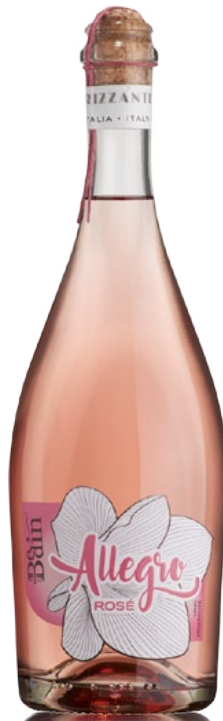
ALLEGRO ROSÉ MARCA TREVIGIANA IGT VINO FRIZZANTE