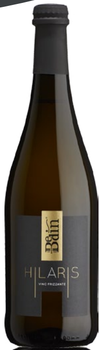
HILARIS MARCA TREVIGIANA IGT VINO FRIZZANTE