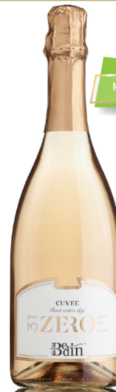
CUVÉE ROSÉ EXTRA DRY VINO SPUMANTE